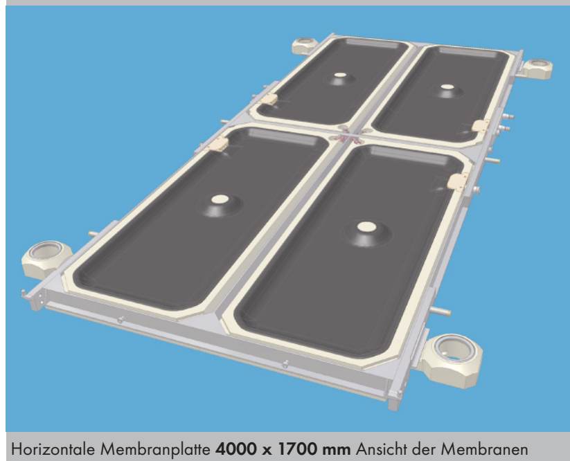
Horizontale Membranplatte 4000 x 1700 mm Ansicht der Membranen