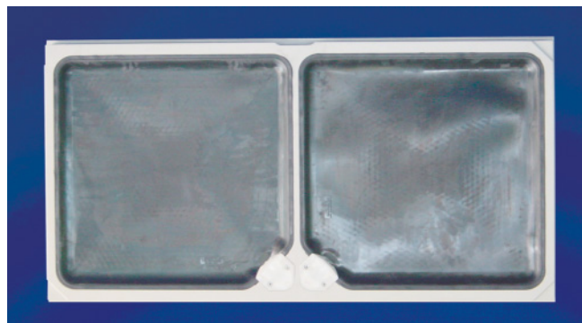
Horizontale Membranplatte 2000 x 1000 mm Ansicht der Membranen